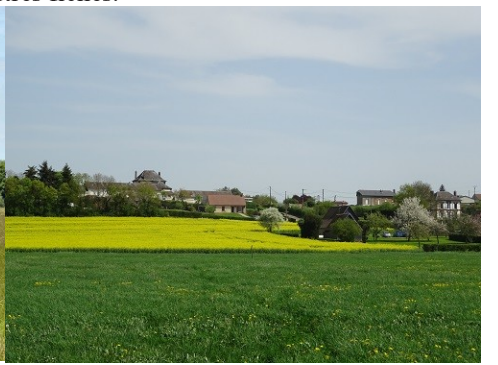
Les abords du monument