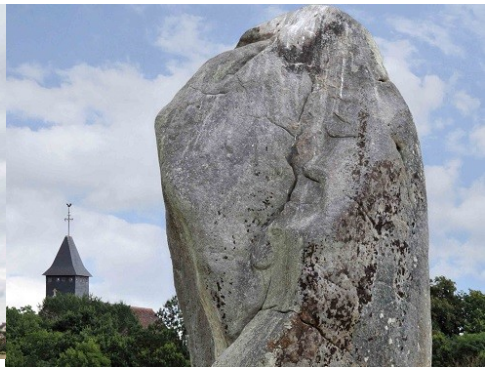
Vue du monument